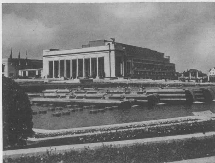
BRÜSSEL, WERELD-TENTOONSTELLING 1935 BRUXELLES, EXPOSITION UNIVERSELLE 1935,