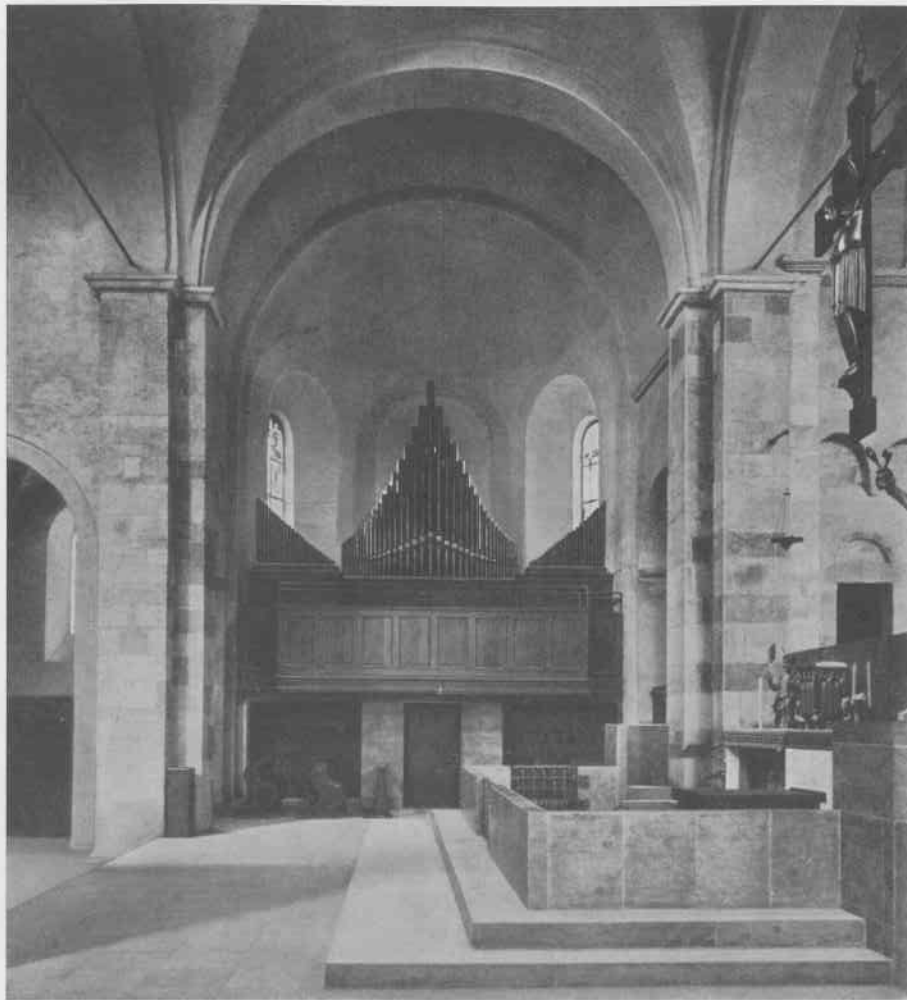
KÖLN, St. Georg