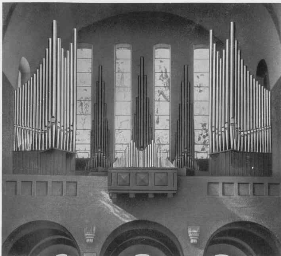
ANTWERPEN, CHR. KONING