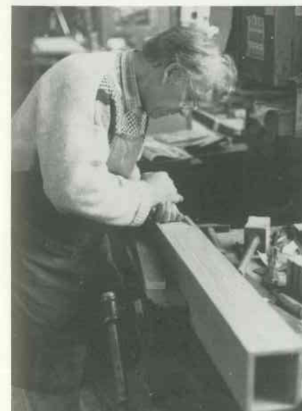
5 Labien bearbeiten