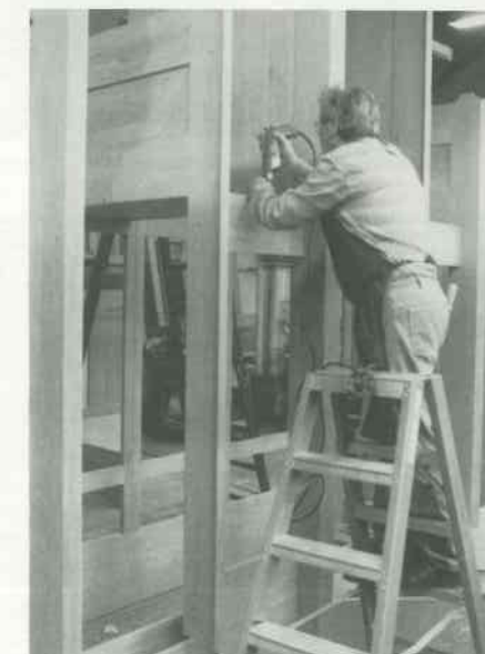
6 Gehäuse zusammenbauen