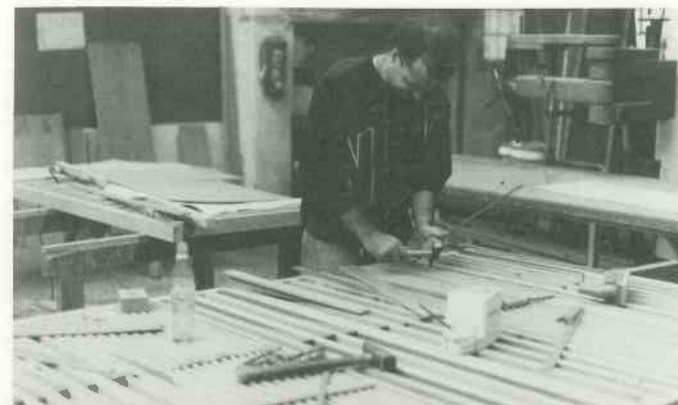
1 Windladenkörper bauen