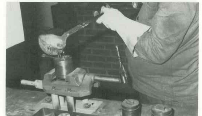
4 Zungenköpfe gießen