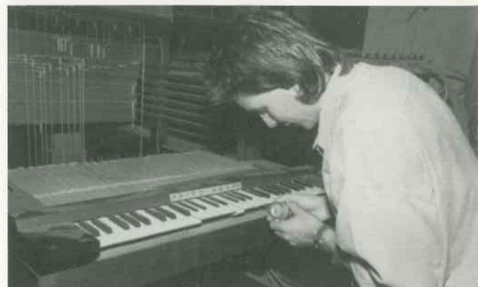
8 Druckpunkte testen