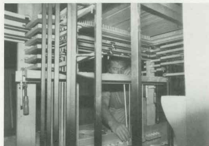
5 Spieltraktur verlegen