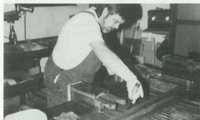
5 Windladen restaurieren