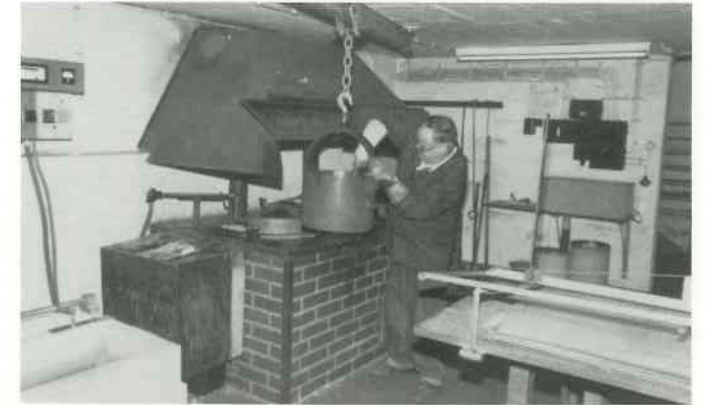
2 Zinnlegierung durchrühren