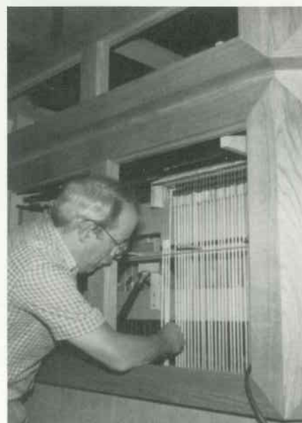
8 Abstrakten einhängen