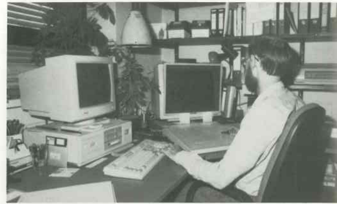
2 Orgelplanung am Bildschirm