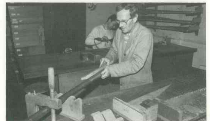
6 Pfeifenkörper rundieren