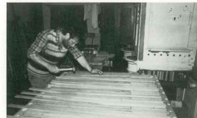
2 Kanzellen ausspunden