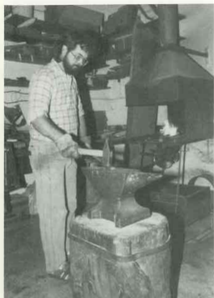
1 Hebel schmieden