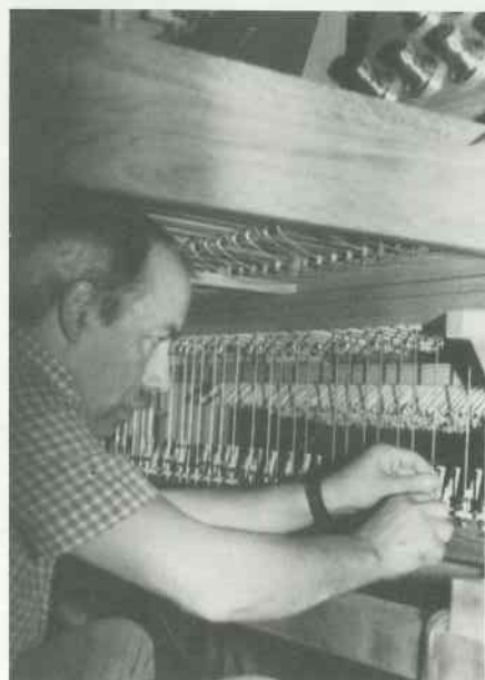
7 Spieltisch montieren