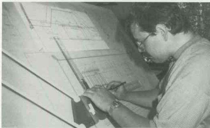
3 Transfer: Kopf → Zeichnung