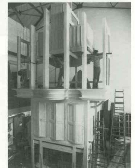
7 Schwellkasten montieren