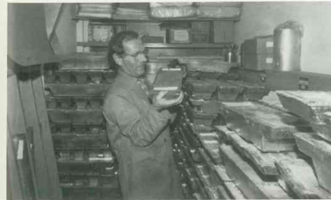
1 Zinnbarren transportieren