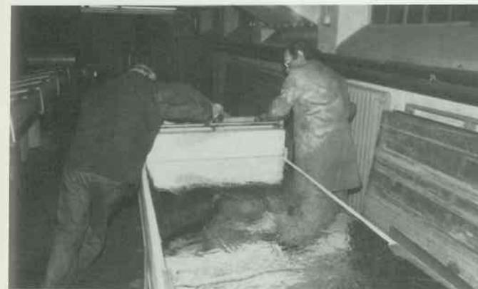
3 Zinnplatten gießen