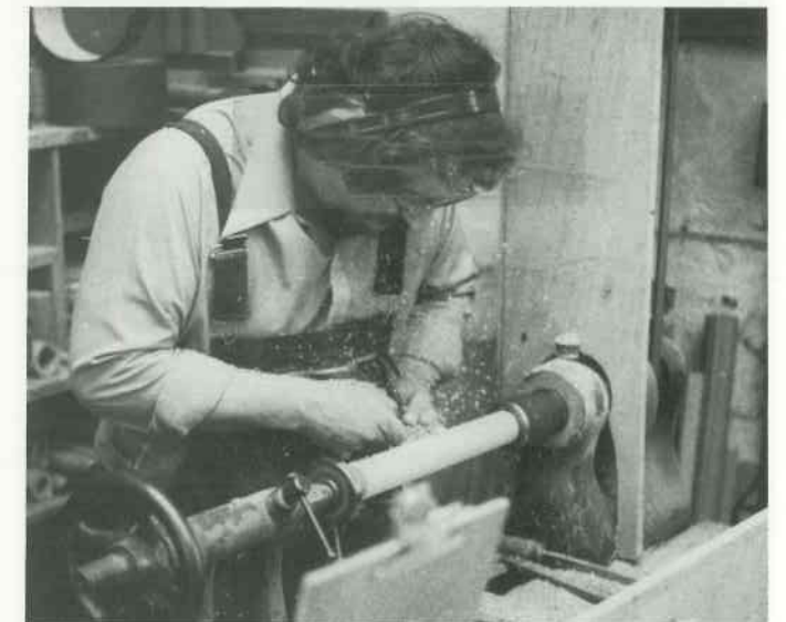
4 Pfeifenfüße dreheln