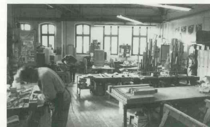
6 Pfeifeneinbau im Montagesaal