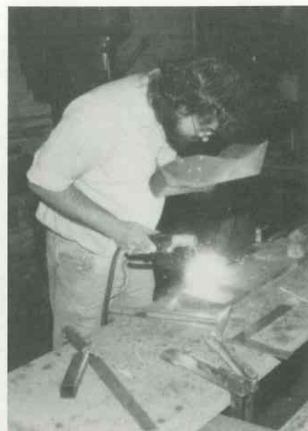
2 Wellen schweißen