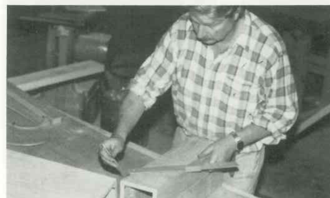
7 Kanalgehungen anreißen