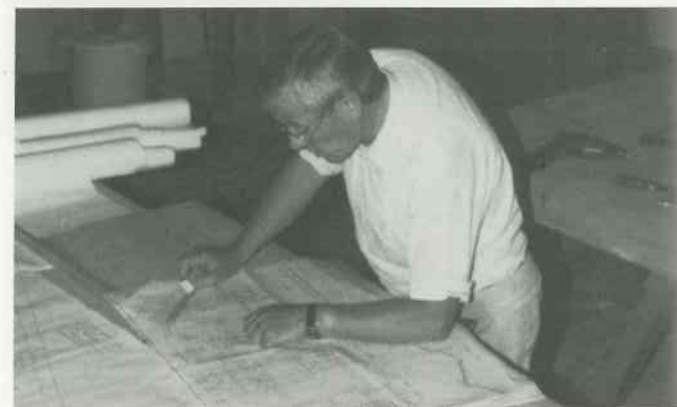
6 Arbeitsvorbereitung Gehäuse