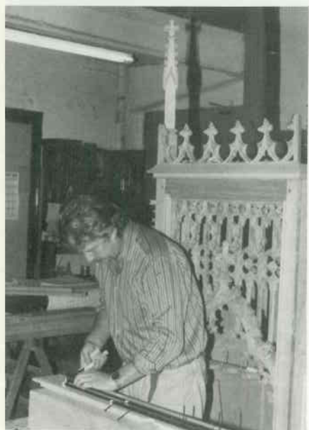
6 Wellen einbauen