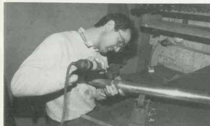
7 Rundnaht löten