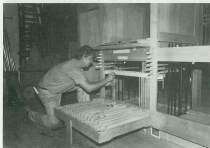
4 Abstrakten einpassen