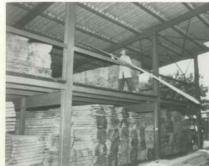
1 Hölzer auswählen