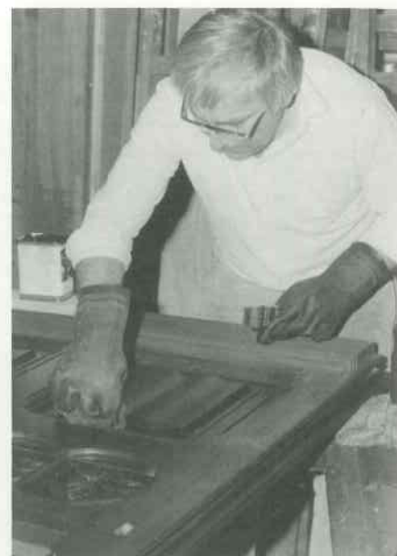
3 Spieltisch-Gehäuse mattieren