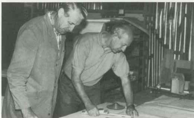
5 Arbeitsvorbereitung Stöcke