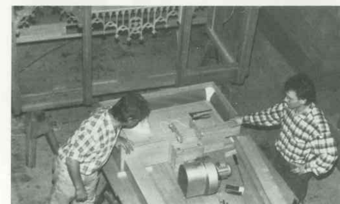
8 Gebläseanlage einrichten