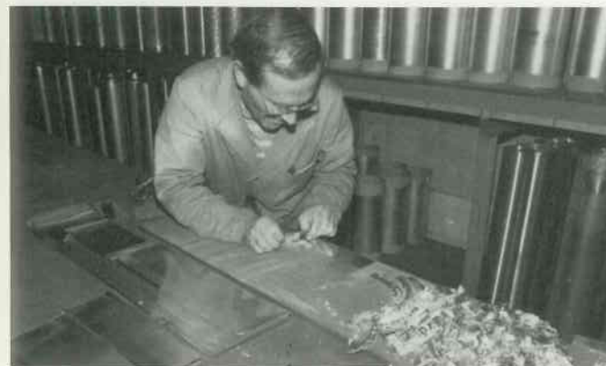
5 Pfeifenmetall ausdünnen