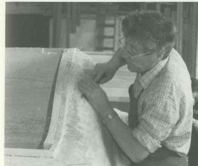
3 Schweifungen ausstemmen