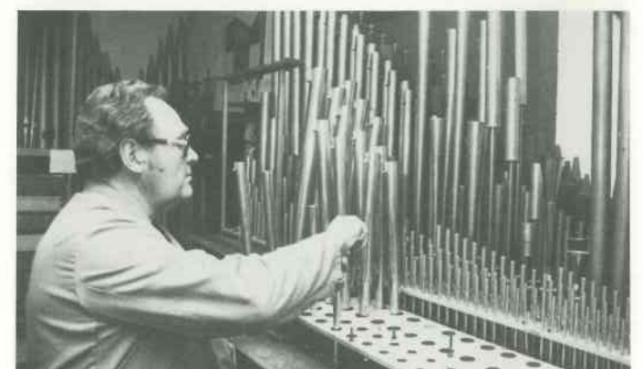
8 Metallpfeifen vorintonieren