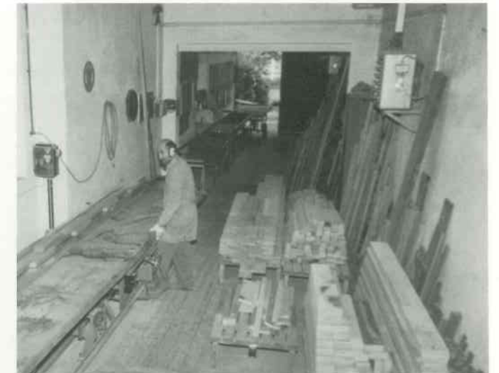
2 Hölzer zuschneiden