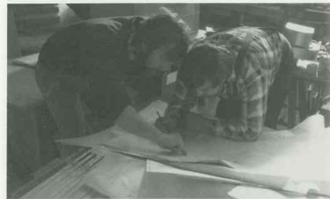
4 Transfer: Zeichnung → Kopf