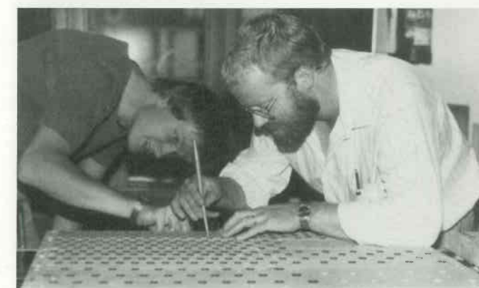
4 Windladen testen